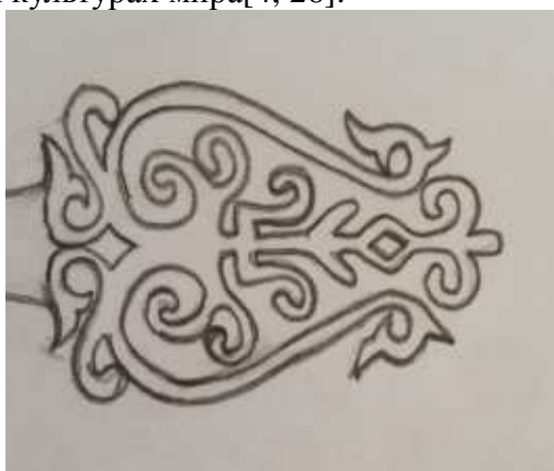
Рис.4. Орнамент символизирует образ девушки

Для данного украшения был создан эскиз с якутским орнаментом в виде цветка лилии-сардана. Она одновременно напоминает якутский музыкальный инструмент хомус и лиру – символ, известный во многих культурах мира[4, 26].