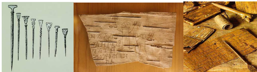
Рис.3. Металлические стержни и берестяные грамоты

В 1951 года русскими археологами в Новгороде были обнаружены берестяные грамоты вместе с заострёнными металлическими и костяными стержнями, известные как инструмент для писания на бересте. До открытия берестяных грамот версия о том, что металлическими стержнями именно писали, не была известна, и их часто описывали как гвозди, шпильки для волос или «неизвестные предметы»[2, 48].