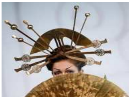
Рис.2. Самурайские шпильки

Известно, что японские самураи использовали шпильки не только как фиксатор причесок, но и как незаменимое оружие.