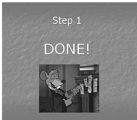
Рис. 2. Пример слайда-терминатора

Для логического перехода к новой части урока используются слайды-терминаторы (рис. 2), означающие завершение логического блока.