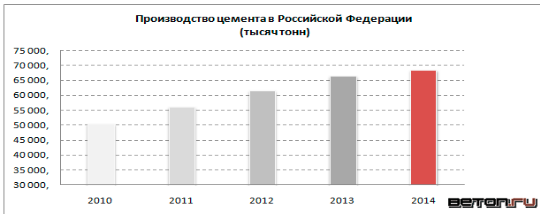
Рисунок 2 – Производство цемента в России за 2010 – 2014 гг.

Согласно данным, опубликованным Федеральной Службой Государственной Статистики, объем произведенного цемента за 12 месяцев 2014 года вплотную приблизился к отметке в 70 миллионов тонн и составил 68 544,8 тысяч тонн. Это на 3,2% больше, чем за тот же период 2013 года, на 11,2% больше, чем в 2012 году, на 22,1% больше, чем в 2011 году и на 36,1% выше уровня 2010 года.