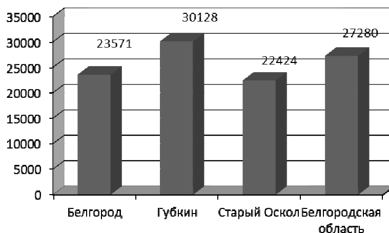
Рис.1. Размер средней заработной платы в городах Белгородской области

Наиболее высокооплачиваемой отраслью в Белгородской области является недвижимость. При этом максимальный размер оплаты труда наблюдается в Старом Осколе - средняя заработная плата в отрасли составляет 88056 руб. Далее идет Губкин – 56611 руб. и Белгород – 53333 руб [1].